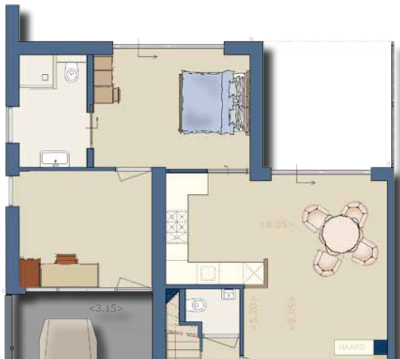
ALTERNATIEF BEGANE GROND

Een van de aantrekkelijke extra's van deze woning is dat de tuinkamer direct of op termijn eenvoudig omgebouwd kan worden tot slaapkamer. Tussen de keuken en de tuinkamer wordt dan een wand met schuifdeur aangebracht, die toegang geeft tot de slaapkamer. De bijkeuken wordt ingevuld als badkamer, met luxe wastafel, zwevend toilet en douchenis. Dit maakt de woning compleet levensloopbestendig.